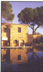
Le domaine Perleas, à Kampos (Chios).